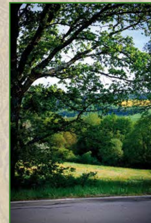
14 | Nadja Donauer | 45 x 30 cm | 75 €