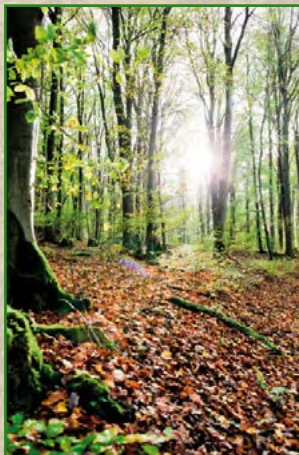
9 | Nadja Donauer | 45 x 30 cm | 75 €