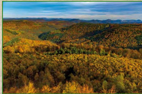
3a | Jens Vollmer | 60 x 80 cm | 150 € oder 3b | 40 x 60 cm | 95 €