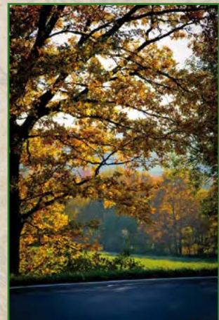
15 | Nadja Donauer | 45 x 30 cm | 75 €