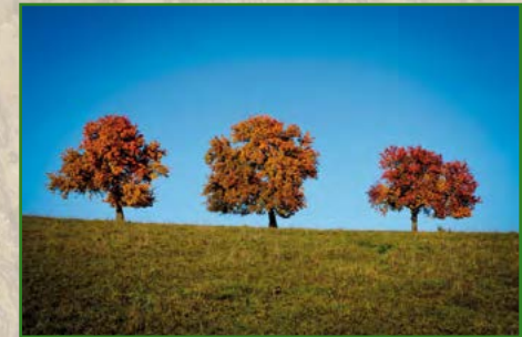
13 | Nadja Donauer | 30 x 45 cm | 75 €