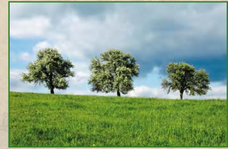
11 | Nadja Donauer | 30 x 45 cm | 75 €