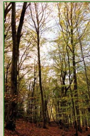
10 | Nadja Donauer | 45 x 30 cm | 75 €