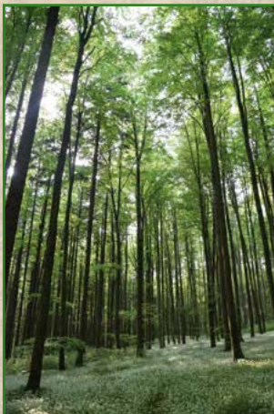
5 | Clemens G. Arvay | 60 x 40 cm | 95 €