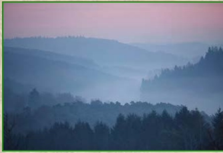
6 | Thomas Brenner | 40 x 60 cm | 95 €