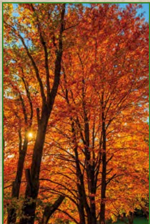
4 | Jens Vollmer | 80 x 40 cm | 115 €