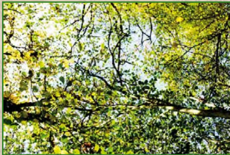
8 | Nadja Donauer | 30 x 45 cm | 75 €