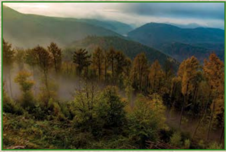
1a | Jens Vollmer | 60 x 80 cm | 150 € oder 1b | 40 x 60 cm | 95 €